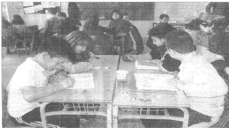
Το 1ο Δημοτικό Σχολείο Πολίχνης είναι ένα από τα πολλά της Θεσσαλονίκης στο οποίο φοιτούν αρκετοί αλλοδαποί και παλιννοστούντες μαθητές.